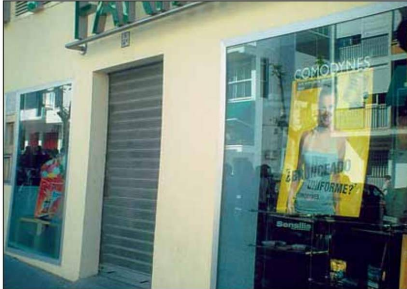
El Consejo Regional de Farmacéuticos de Castilla-La Mancha (Cofcam) espera que la solución al impago de las facturas farmacéuticas llegue de forma "muy urgente" y que sea la administración la que garantice un gasto que origina ella y no los propios boticarios.

La decisión de estudiar la viabilidad de la propuesta de los farmacéuticos se produjo al mismo tiempo que María Dolores de Cospedal, presidenta de la comunidad, anunció su plan de recortes que pretende ahorrar en la comunidad 1.815 millones de euros. Es decir, el 20 por ciento del presupuesto.