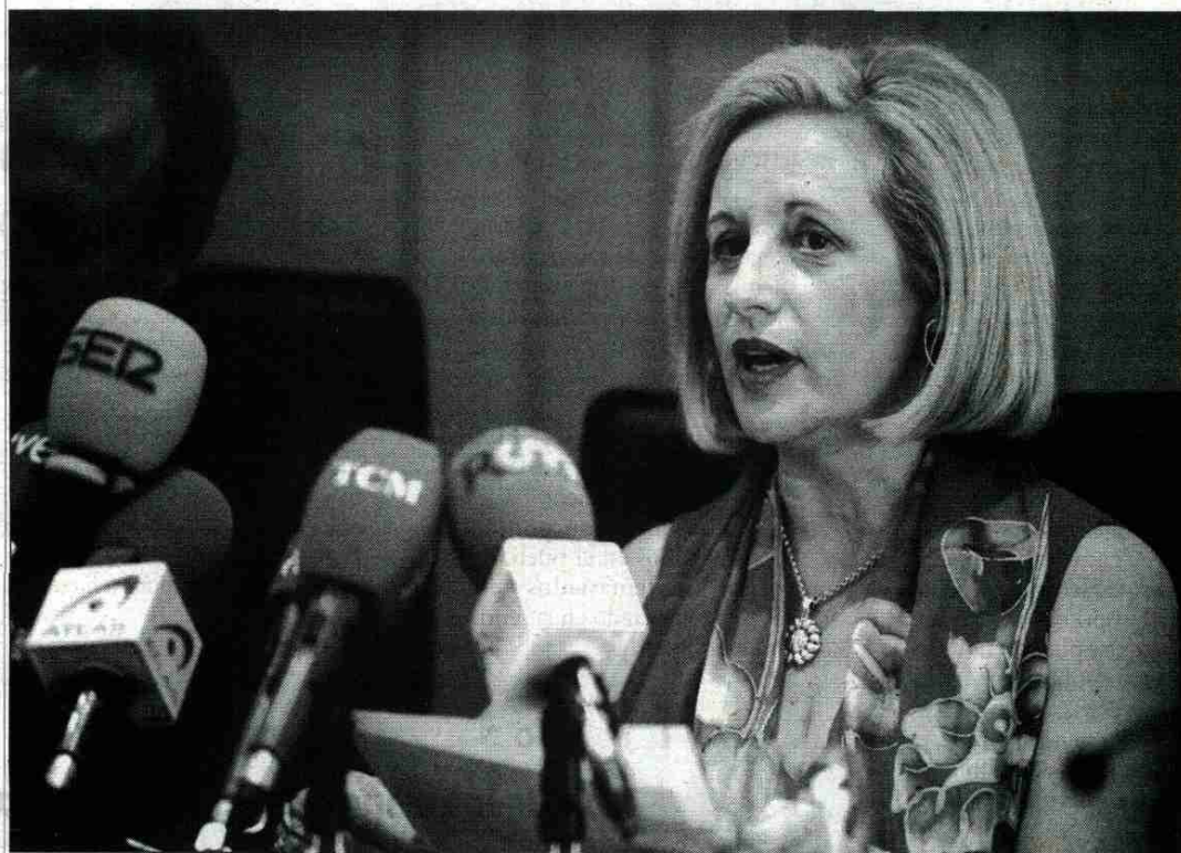
La presidenta de la Federación de Empresarios Farmacéuticos de Castilla-La Mancha (Fefcam).

Además, he defendido que con sus declaraciones en las últimas semanas ha ejercido su "obligación y responsabilidad" de defender los intereses de las oficinas de farmacia que representa y ha añadido que se ha limitado a exponer la verdad de la situación de las farmacias, que se encuentran en una situación "crítica y complicada" por los impagos. Asimismo, ha manifestado que la