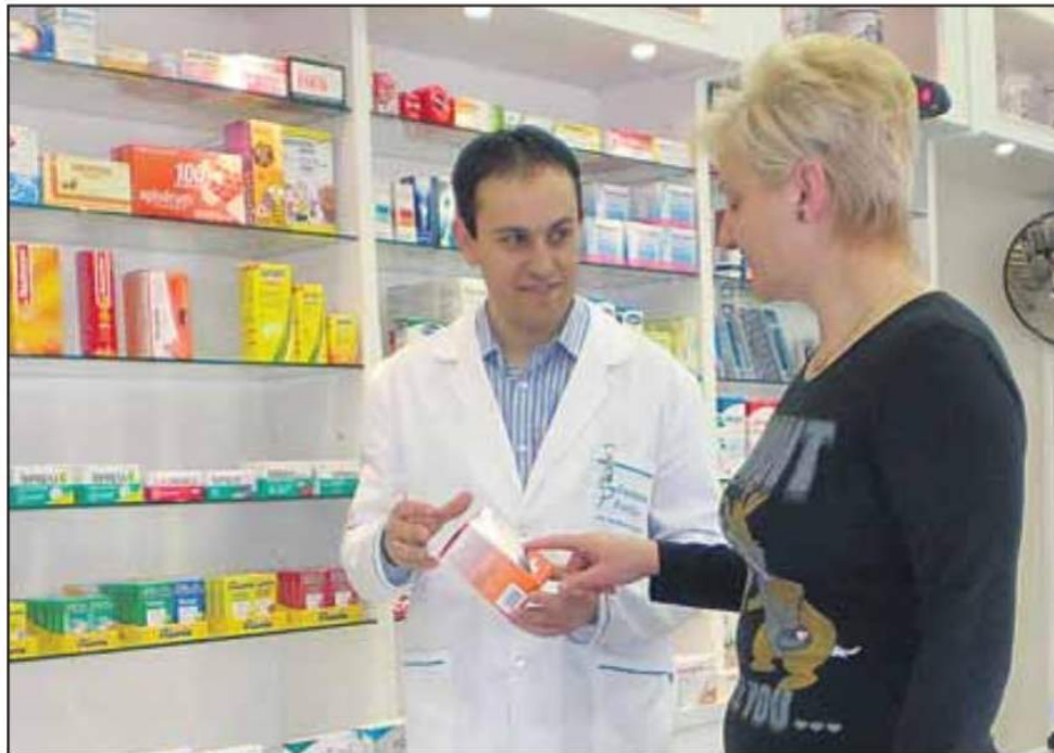
La subida salarial del tres por ciento y la posibilidad de firmar convenios individuales fueron los principales escollos para que las partes de la mesa negociadora del convenio colectivo para oficinas de farmacias alcanzaran un acuerdo.