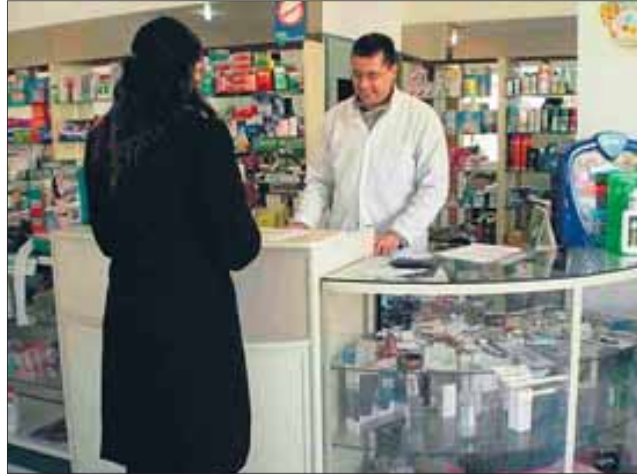
De cara a 2011, FEFE pronostica que el mercado de genéricos tendrá pocas posibilidades para alcanzar el 10 por ciento de cuota de mercado total por las bajadas de precio.

El crecimiento del mercado de genéricos se mostró muy irregular durante 2010, según las conclusiones del último Observatorio de FEFE. Mientras que los diez primeros fabricantes de EFG del país aumentaron sus ventas en conjunto un 14 por ciento respecto al año anterior, las del resto de compañías cayeron hasta un 25. El top ten acaparó todo el protagonismo financiero y aumentó su peso respecto al resto de laboratorios. En el número uno se colocó Teva, seguida de Cinfa, Stada y Kern. Y un dato histórico: por primera vez, dos laboratorios de EFG consiguieron posicionarse entre las 20 principales compañías farmacéuticas. P.18